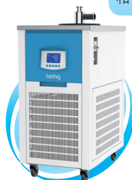
干式冷阱(液体回收)